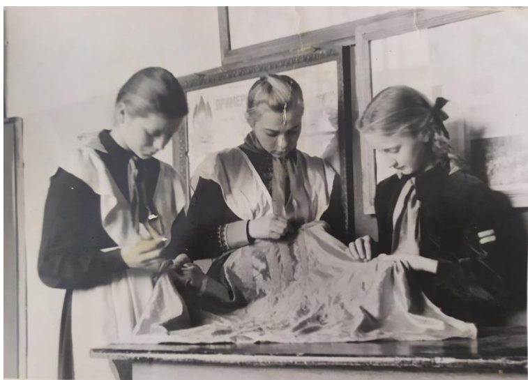
К 40-летию ВЛКСМ пионеры дружины вышивали знамя в подарок школьным комсомольцам

Каждый пионер имел личную книжку, где Совет дружины отмечал выполнение им того или иного задания. Чтобы