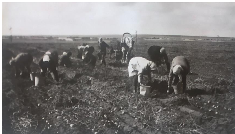
На уборке урожая в подшефном хозяйстве