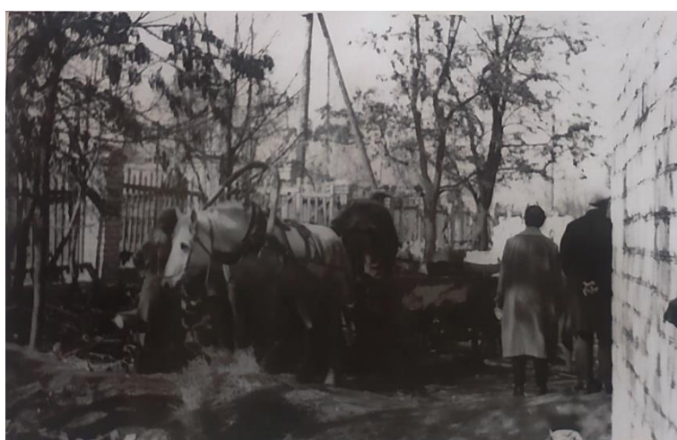
И металл очень нужен стране...