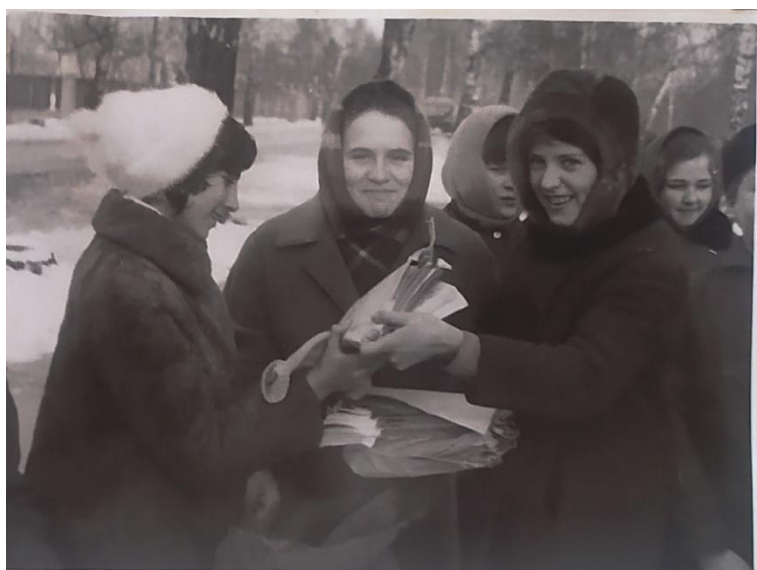
Соберем макулатуру – сохраним жизнь деревьям!