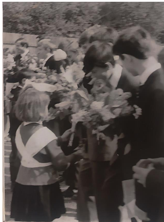
Прощай школа! Линейка, посвященная выпуску 1970 года