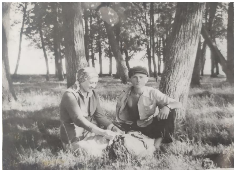
В походе (Лопандино)

Приходила летняя пора со всеми своими прелестями. И тогда отправлялись Мы с пионерами в походы. Остались в памяти походы по родному краю: Лопандино, Ивановское, Севск, Трубчевск. Ночёвки у костра, песни, рассказы. Романтика! А какое удовольствие испытывали все во время купания в речках, озёрах, встречавшихся на пути. Мы были организаторами первых летних площадок по улицам.