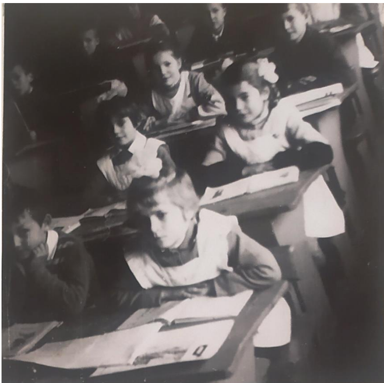
Мы уже октябрята