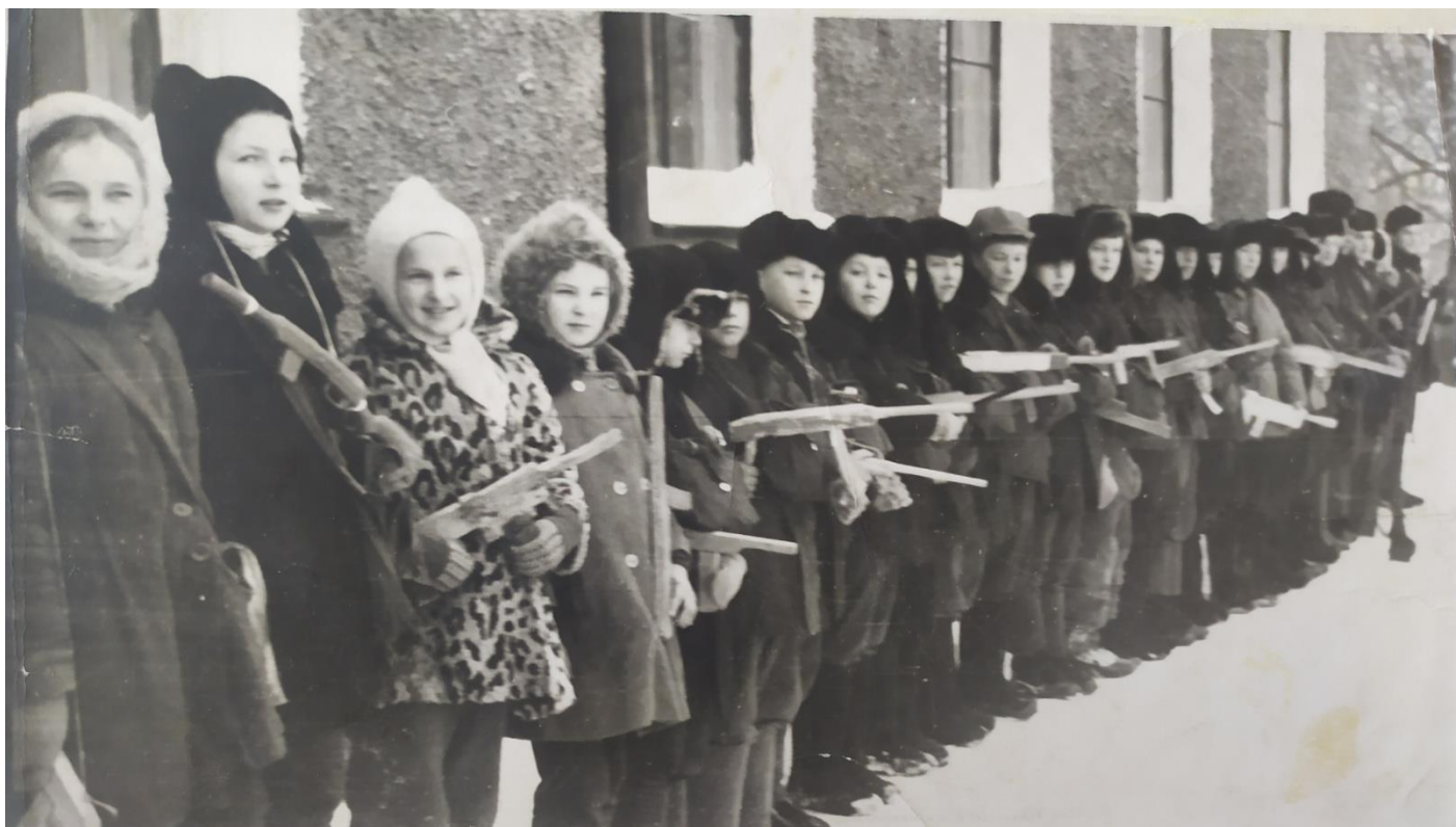
Зарница – любимая игра

Пусть над вами всегда будет чистое небо!