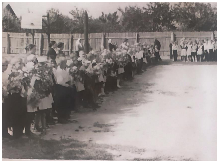
Первая в жизни школьная линейка! 1 сентября 1971 года