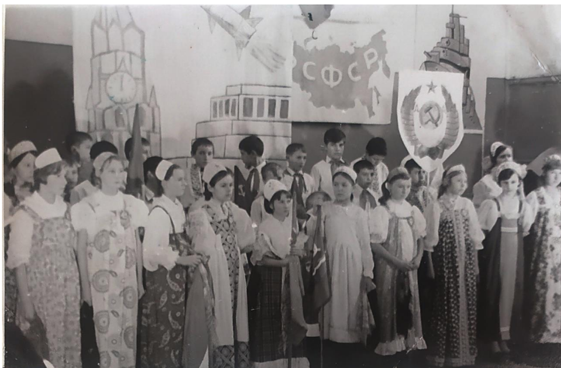
Каждый пионерский отряд с большим творческим подъемом готовился к встрече 50-летия образования СССР