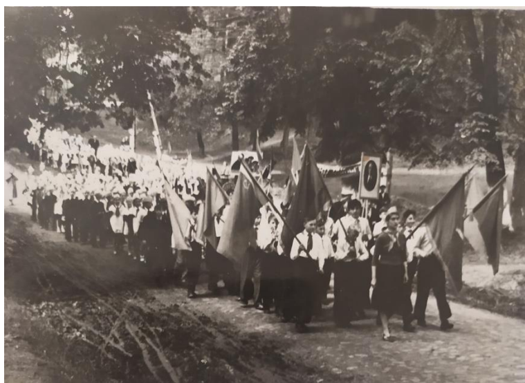
20 мая 1962 года. Празднование 40-летия Всесоюзной пионерской организации имени В.И. Ленина

1958 год. Оглянешься назад, и кажется, как давно это было. Ровно 13 лет прошло, а так свежо всё в памяти. «А годы летят, наши годы, как птицы, летят, и некогда нам оглянуться назад!»