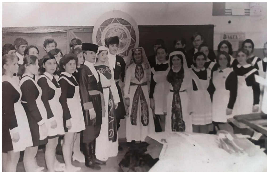
Комсомольцы 10 «Г» класса посвятили свое выступление солнечной Грузии. Очень интересно рассказывают они о природе и экономике республики, поют чудесные песни Грузии