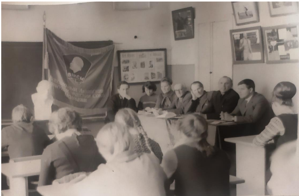
Ленинский зачет, 1971 год

Каждый год двери школы гостеприимно открываются перед дорогими выпускниками