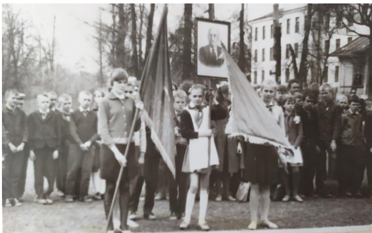
Прием в пионеры и комсомол 22 апреля 1970 года

22 апреля 1970 года каждый отряд рапортовал на собрании дружины о своей работе.