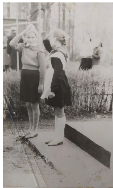
Смена почетного караула у памятника В.И. Ленина

Кроме этого пионерами проводились конкурсы на лучшего чтеца стихотворений о комсомоле, на лучшее исполнение комсомольской