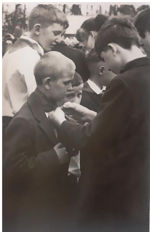
А сегодня я стал пионером